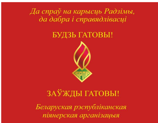
Знамя пионерской дружины (лицевая сторона)