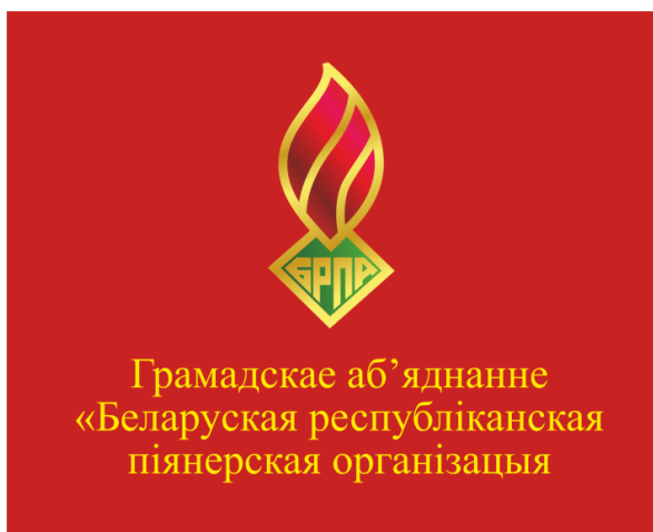
Знамя ОО «БРПО» (лицевая сторона)