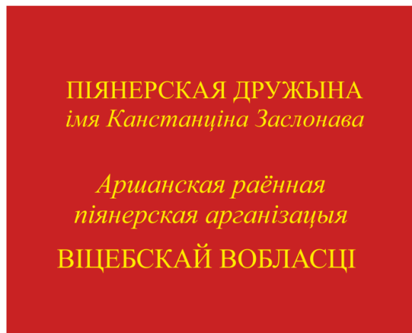
Знамя пионерской дружины (оборотная сторона)