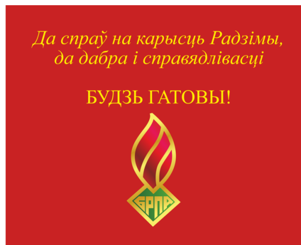
Знамя ОО «БРПО» (оборотная сторона)